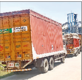
सैलो के बाहर पहुंचे ट्रक।