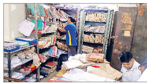
गन्नौर। पुराने तहसील भवन में पटवारी के कार्यालय में रिकार्ड निकालता निजी व्यक्ति।

सरकारी राजस्व कार्यों में अनधिकृत दखल का मामला सामने आया है, जहां क्षेत्र के कई पटवारी अपने कार्यालयों में निजी सहायकों से काम करा रहे हैं। हैरानी की बात यह है कि जमीन से जुड़ा महत्वपूर्ण रिकार्ड भी इन सहायकों की पहुंच में है, जिससे पूरी व्यवस्था की पारदर्शिता और सुरक्षा पर सवाल खड़े हो गए हैं। सरकारी कार्यों में निजी व्यक्तियों की बढ़ती दखल से व्यवस्था की पारदर्शिता प्रभावित हो रही है। पटवारी अपने स्तर पर पैसे देकर इन सहायकों को रखते हैं और उनसे सरकारी कार्य करवाते हैं। ग्रामीणों का कहना है कि काम के लिए आने वाले लोगों से कुछ निजी सहायक रुपये भी मांग लेते हैं, जिससे उन्हें अतिरिक्त आर्थिक बोझ उठाना