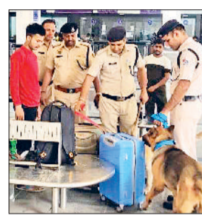
सोनीपत। स्टेशन पर यात्रियों के सामान की जांच करती डॉंग स्ववाड टीम।

रेलवे स्टेशन पर सुरक्षा व्यवस्था को कड़ा करने के लिए मंगलवार को दिल्ली से आई डॉंग स्ववाड टीम ने विशेष जांच अभियान चलाया। यह जांच अभियान अलग-अलग दिन दिल्ली रेल मंडल के अंतर्गत आने वाले विभिन्न रेलवे स्टेशनों पर चलाया जा रहा है। इसी कड़ी में टीम ने स्टेशन परिसर की जांच कर सुरक्षा व्यवस्था को जांचा। साथ ही डॉंग स्ववाड टीम ने रेलवे स्टेशन परिसर व ट्रेनों में यात्रियों के सामान की गहन जांच की। सोनीपत स्टेशन पर जांच अभियान में आरपीएफ व जीआरपी कर्मियों ने भी सहयोग किया। डॉंग स्ववाड टीम के साथ जीआरपी व आरपीएफ कर्मियों ने स्टेशन के प्रत्येक प्लेटफार्म पर यात्रियों के सामान,