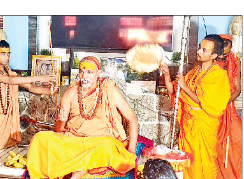
सोनीपत। पत्रकारों से बातचीत करते शंकराचार्य स्वामी अविमुक्तेश्वरानंद सरस्वती।

शंकराचार्य स्वामी अविमुक्तेश्वरानंद सरस्वती ने कहा कि सवाल है कि विकसित भारत किस रूप में, यह हार्लैंड, पोलेण्ड जर्मन, सिंगापुर, बीजिंग बन जाए। अगर इन रूप में विकसित होना है, तो इसमें भारत का कोई लेना-देना नहीं है। बीजिंग, संगाही बनेगा, तो चीन बन जाएगा, स्वीटजरलैंड बनेगा, तो फिर भारत