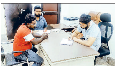
खरखौदा। नगर पालिका में अपना रजिस्ट्रेशन करते रेहड़ी वाले