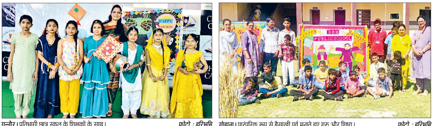
गन्नौर। प्रतिभागी छात्र स्कूल के शिक्षकों के साथ।