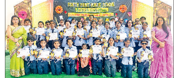
सोनीपत। अवार्ड प्राप्त करने के बाद सीईओ के साथ प्रमाण पत्र दिखाते हुए।