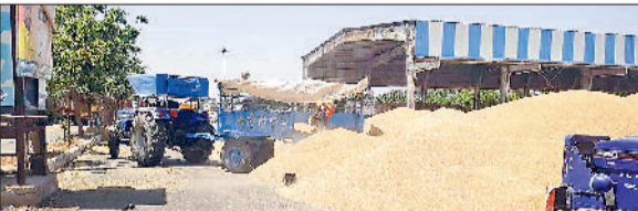
सोनीपत। अनाज मंडी में सड़क पर लगी गेहूं की ढेरियां।

जिले की अनाज मंडियों व खरीद केंद्रों पर गेहूं की खरीद प्रक्रिया ज्यादा धीमी होने से किसान परेशान होने लगे हैं। रोहतक रोड स्थित नई अनाज मंडी में गेहूं की सरकारी खरीद केवल दिखावा मात्र रह गई है। ऐसे में मंडियों व खरीद केंद्रों पर गेहूं के ढेर सड़कों तक लगने लगे हैं। इसके अलावा आदितियों के पास बारदाने की भी बड़ी समस्या है। बारदाना न मिलने के कारण न तो समय पर गेहूं की सरकारी खरीद हो रही और न ही उठान हो रहा। सोनीपत की नई अनाज मंडी में करीब 2 लाख क्विंटल गेहूं खुले में पड़ा। खुले में पड़ा गेहूं प्रशासन से प्रबंधकों के दावों की पोल खोलना नजर आ रहा है। सोनीपत में 2